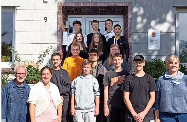
Die Schülergruppe „50+“ des Schuljahres 2023/2024

Die Schülerfirma „KGS Works“ der Kooperativen Gesamtschule Schneverdingen ist ein wirtschaftsnaher Unterricht für den 10. Jahrgang des Haupt- und Real-schulzweiges.